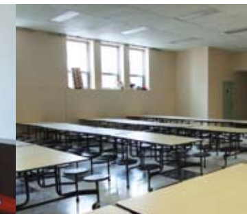
Salle à manger et cuisine

Le Gouvernail : un programme d'hébergement pour personnes à risque d'itinérance