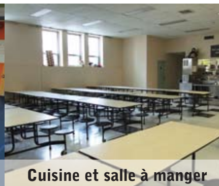
Cuisine et salle à manger